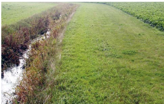
Niidetud puhverriba pole kohustuslik, vaid üks võimalusi.

Väetiseks loetakse ka kõik orgaanilised väetised, sh sõnnik. Maaparandussüsteemi eesvool on liigvee ärajuhtimiseks või vee juurdevooluks rajatud veejuhe või loodusliku veekogu reguleeritud lõik, millest sõltub reguleeriva võrgu nõuetekohane toimimine (Maaparandusseaduse § 3 lõige 7). Tavaline veepiir on Maa-ameti põhikaardil märgitud veekogu piir.