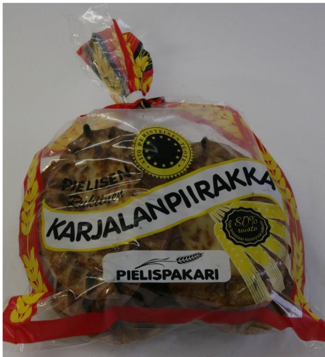
Karjalanpiirakka(FI) Mozzarella (IT)