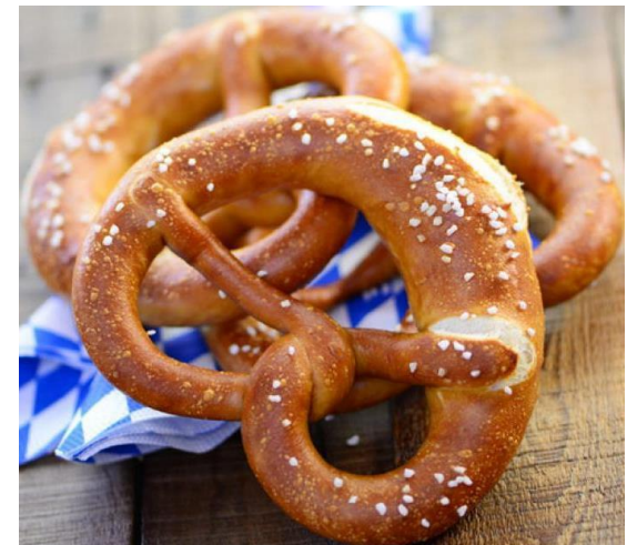
Beyerische Breze(D E)