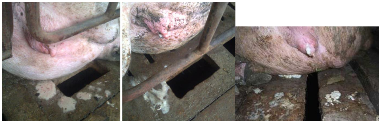
Фото 2. Патологические выделения из влагалища свињи.

Авторские права принадлежат Университету Естественных Наук Эстонии, и имущественные права принадлежат заказчику материала. Материал был подготовлен Министерством сельского хозяйства и Департаментом сельскохозяйственных регистров и информации (PRIA) в 2019 году. Все авторские права защищены.