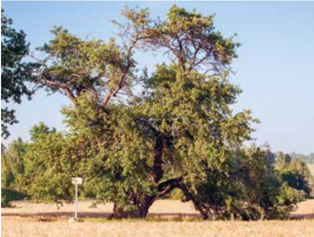
Oti metsõunapuu Viljandimaal.

Analoogne nõue on HPK nõudena kehtinud alates 2010. aastast, täpsustatud on konkreetset looduse üksikobjektid, mis võivad põllumajandusmaal esineda.