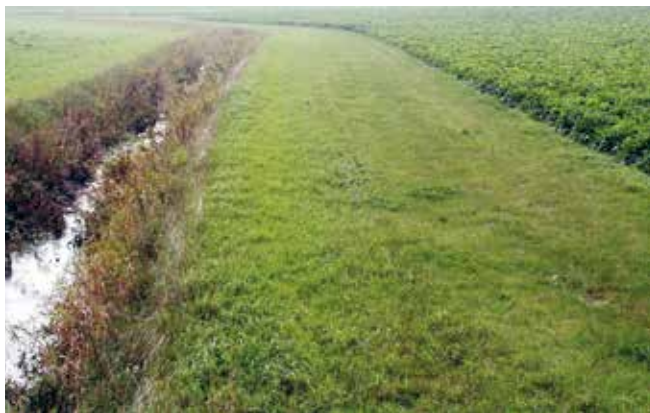
Puhverriba niitmine pole kohustuslik, vaid üks võimalusi.

Kui peakraav, kanal või maaparandussüsteemi eesvooluks olev kraav on Eesti topograafia andmekogu põhikaardile kantud joonobjektina, on puhverriba ulatuse arvestamise lähtejooneks süvendi serv.