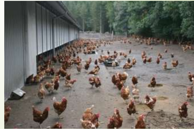
➤ Mahekanala Taanis