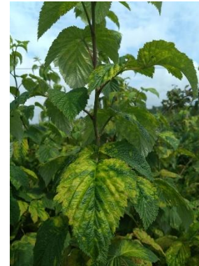
Foto: Vaarikalesta kahjustus hariliku vaarika lehtedel, EMÜ Taimeterwise õppetool, Kaire Loit

Vaarikalest on umbes 0,15 mm pikkune kahe paari jalgadega ämblikulaadne, vastne ja valmik on sarnased. Vaarika pungasoomuste vahel talvitunud lestad liiguvad kevadel mööda taime laiali ja imevad rakumahla peamiselt lehtede alaküljel. Kahjustuse tagajärjel ilmuvad lehtedele ebaselgete piiridega kahvatud helekollased laigud. Hiljem võib muutuda kogu leht kahvatuks. Kahjustunud lehed tõmbuvad heledamate kohtade pealt kipra, känguvad, ning arvukal esinemisel võib kahjustuda kogu taim. Kahjustus on tugevamvarjulistes ja niiskemates kohtades, Kahjurist hoidumine põhineb peamiselt kahjurikindlamate või vähemkahjustuvate sortide kasvatamisel ning sobiva (päikeselise ja õhurikka) kasvukoha valikul. Kuna lestad on palja silmaga nähtamatud, aetakse esmast kahjustust sageli segamini viirushaiguste või toitumishäiretega (laigud lehtedel).