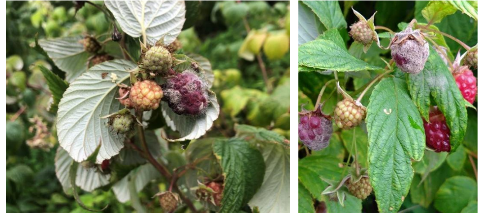
Foto: Hahkhallituse sümptomid võtsetel. https://pnwhandbooks.org/plantdisease/host-disease/raspberry-rubus-spp-fruit-rot-cane-botrytis (Lisa Jones, 2014)

Foto: Hahkhallituse nakkus viljadel. EMÜ Taimeterwise õppetool (Kaire Loit)