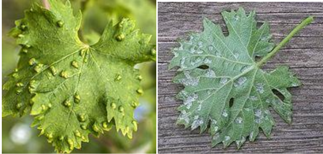
Pahad viinapuu lehe ülemisel küljel ja ümarjad sisselangenud laigud lehe alumisel küljel

Väga väikesed (0.18 x 0.05 mm). usja keha, 2 jalapaari ja kollaka kuni kreemja värvusega pahklestad. Täiskasvanud pahklest talvitub pungasoomuste vahel või koorepraos. Kevadel kui temperatuur on tõusnud üle 15 °C. ilmuvad lestad meie istandustes noortele lehtedele. Imedes taimemahla, viiakse taimesse kasvuainet, mistõttu lehe pealispinnale kerkivad rohelised, kollaka varjundiga võlvunud pahad. Lehe alumisele poolele tekib kahjustuskohas ümmargune sisse langenud nõgu, mille taim katab peenikeste valkjate niitidega. Hiljem kattub nendega kogu lehe alumine pool. Emane muneb jätkuvalt pahka ja kui asustustihedus läheb pahas suureks väljub pahast ja leiab uue asukoha. Suve lõpupoole (tavaliselt augustis) muutuvad niidid lehe alumisel küljel pruuniks ning valmikud lahkuvad pahkadest ja lähevad pungadesse talvituma.